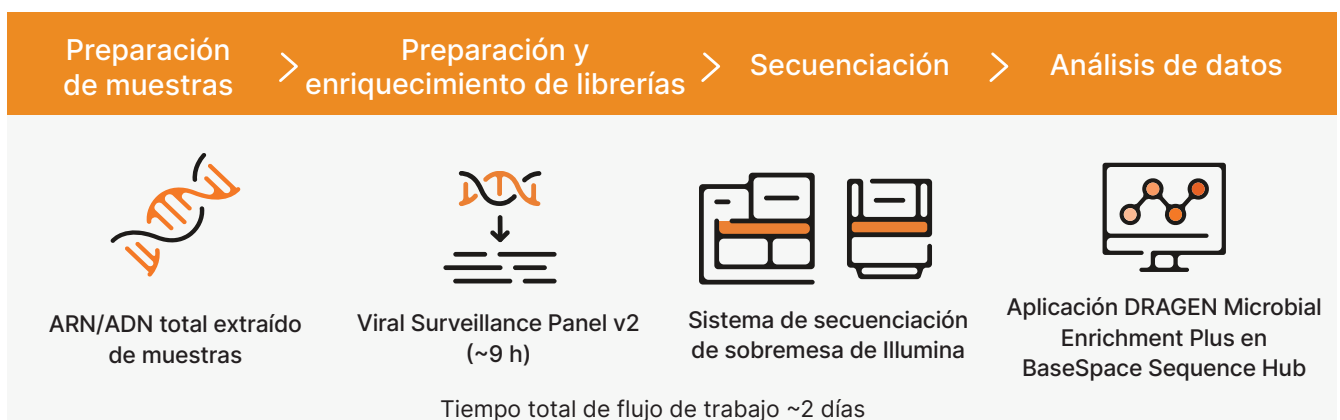
Figura 1: Flujo de trabajo de Viral Surveillance Panel v2. En un flujo de trabajo optimizado y completo, las librerías se preparan a partir de muestras del entorno o del huésped, se secuencian en un sistema de secuenciación de Illumina y se analizan con la aplicación DRAGEN Microbial Enrichment Plus para la detección vírica, la generación por consenso del genoma completo, la asignación de lecturas a las mejores mutaciones víricas y la caracterización de cepas. El tiempo de secuenciación varía según la profundidad de lectura de la muestra y el sistema de secuenciación que se use.

El flujo de trabajo de preparación de librerías de Viral Surveillance Panel v2 consta de pasos de preenriquecimiento y enriquecimiento. El preenriquecimiento genera cientos de miles de librerías no específicas que se enriquecen con sondas Viral Surveillance Panel v2 mediante un enfoque de captura híbrida. El enriquecimiento con tagmentación en bolas ofrece un flujo de trabajo rápido y compatible con la automatización que se puede realizar en aproximadamente dos días con un tiempo de participación activa mínimo. El protocolo admite cantidades de aporte de muestras que oscilan entre 10 ng y 100 ng de ácido nucleico total y admite la multiplexación de hasta 384 muestras en un experimento único.