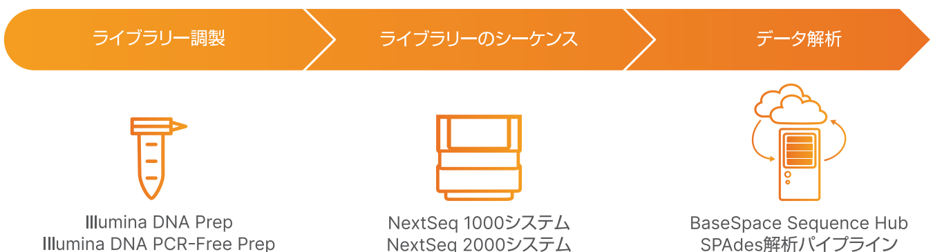
図1: NextSeq 1000およびNextSeq 2000システムでのWGSワークフロー: ユーザーが使いやすい効率的なNGSワークフローには、ライブラリー調製、シーケンス、データ解析が含まれます。NextSeq 1000/2000 P1 Reagents (600 Cycles)キットのシーケンスランタイムは約34時間であり、NextSeq 1000/2000 P2 300M Reagents (600 Cycles)フローセルのランタイムは、約44時間です。

この研究では、American Type Culture Collection (ATCC)から選択した利用可能な細菌分離株を評価しました(表1)。個々のシーケンスライブラリーの生成には各サンプル1 ngを用いました。各細菌分離株について、Illumina DNA Prep, (M) Tagmentation (24 Samples, IPB) (イルミナ、カタログ番号: 20060060) およびIDT for Illumina DNA/RNA UD Indexes Set A, Tagmentation (96 Indexes, 96 Samples) (イルミナ、カタログ番号: 20027213) を用いて、2つのテクニカルレプリケートを調製しました。