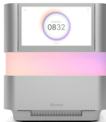
Figura 1: NextSeq 2000 Sequencing System. NextSeq 2000 System è caratterizzato da un design innovativo, chimica avanzata, bioinformatica semplificata e un flusso di lavoro intuitivo, che lo rendono il sistema di sequenziamento da banco più flessibile e adattabile e quello utilizzabile con la gamma più estesa di applicazioni.

NextSeq 1000 System e NextSeq 2000 System si basano sulla chimica XLEAP-SBS, una chimica SBS più veloce, di qualità superiore e più solida retta dalle comprovate fondamenta della chimica SBS standard di Illumina. I nucleotidi della chimica XLEAP-SBS utilizzano coloranti innovativi, nuovi leganti e blocchi più resistenti al calore e mostrano un'idrolisi ridotta di 50 volte e una scissione del blocco più veloce di 2,5 volte per ridurre la determinazione delle fasi e la predeterminazione delle fasi. La polimerasi di XLEAP-SBS è stata progettata per incorporare più velocemente i nucleotidi e offrire una maggiore affidabilità come mai prima d'ora.