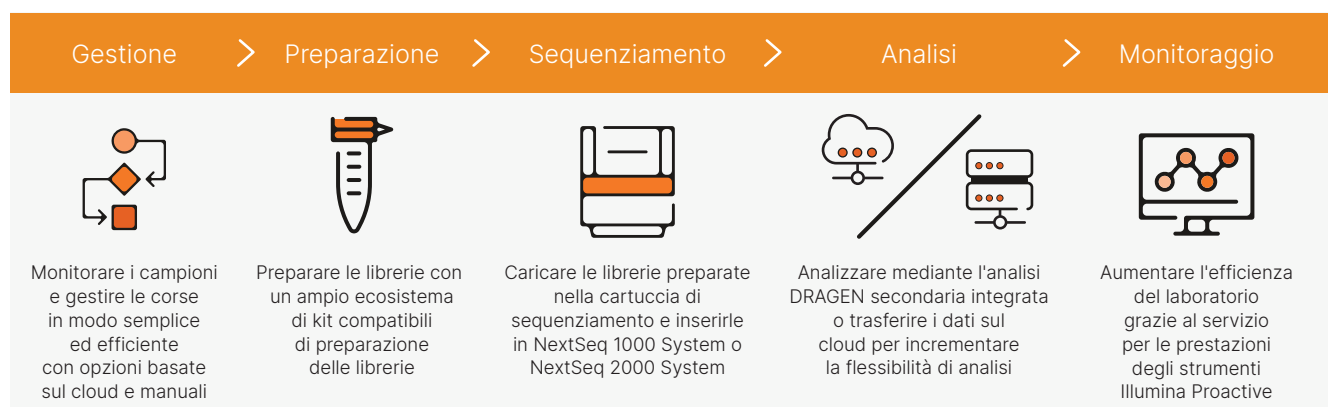
Figura 2: flusso di lavoro intuitivo dalla libreria all'analisi. NextSeq 1000 System e NextSeq 2000 System offrono un flusso di lavoro completo, che include semplice impostazione della corsa, ampio ecosistema di kit compatibili per la preparazione delle librerie, funzionamento "carica e vai" e analisi secondaria integrata sullo strumento.

c. I punteggi qualitativi si basano su una libreria del campione di controllo PhiX di Illumina; le prestazioni possono variare a seconda del tipo e della qualità della libreria, della dimensione dell'inserito, della concentrazione di carico e di altri fattori sperimentali.