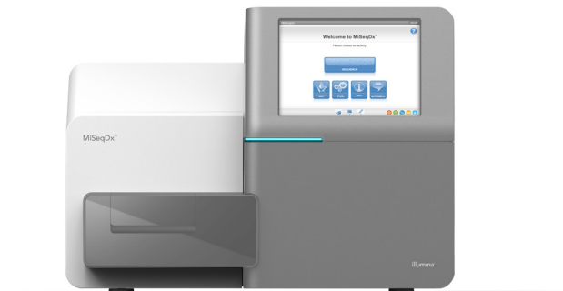
Figura 1: MiSeqDx Instrument. MiSeqDx Instrument para IVD, autorizado por la FDA y con certificación CE, ofrece un flujo de trabajo sencillo, una interfaz de software intuitiva y una mayor seguridad para los usuarios.

MiSeqDx Instrument es el primer instrumento diseñado para la secuenciación de nueva generación (NGS, next-generation sequencing) autorizado por la Administración de Alimentos y Medicamentos (FDA, Food and Drug Administration) de EE. UU. y con la certificación de Conformidad Europea (CE) para diagnóstico in vitro (DIV) (figura 1). MiSeqDx Instrument, diseñado específicamente para entornos de laboratorio clínico, ocupa poco espacio (0,3 metros cuadrados) y aporta un flujo de trabajo fácil de seguir, así como rendimiento de datos adaptados a las diversas necesidades de los laboratorios clínicos. Además, el software integrado en el instrumento permite configurar experimentos, realizar el seguimiento de las muestras, gestionar usuarios, generar registros de auditoría e interpretar los resultados.* Gracias al aprovechamiento de los procesos químicos de secuenciación por síntesis (SBS, sequencing by synthesis) demostrada de Illumina, MiSeqDx Instrument permite un cribado y unas pruebas diagnósticas exactas y fiables.