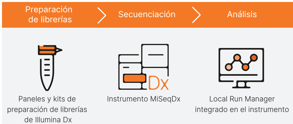
Figura 2: Procesos para ensayos de MiSeqDx en tres pasos. MiSeqDx Instrument forma parte de una solución integrada que incluye la preparación de librerías y el análisis de datos para ensayos diagnósticos moleculares. Los informes con resultados detallados solo están disponibles con ensayos específicos según el objetivo, como TruSight Cystic Fibrosis 139-Variant Assay y TruSight Cystic Fibrosis Clinical Sequencing Assay.