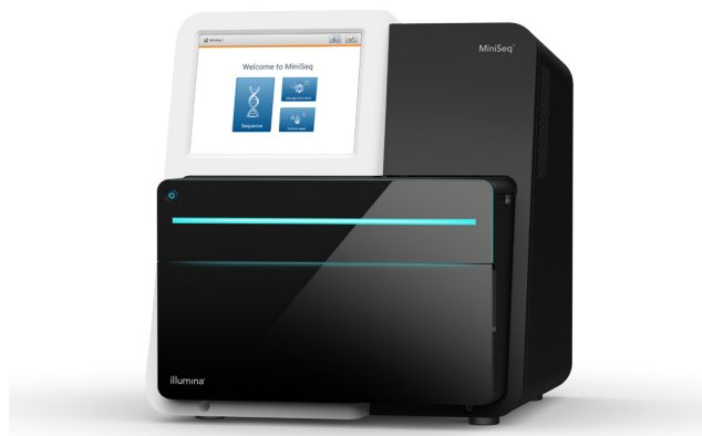
Figure 1 : MiniSeq System : en exploitant les progrès de la chimie SBS et des flux de travail simples et rationalisés, MiniSeq System offre une solution de préparation des bibliothèques aux résultats puissante et facile à utiliser.

MiniSeq System, avec une interface utilisateur intuitive et un fonctionnement de type chargement-exécution, est facile à apprivoiser et à utiliser. Il réalise l'amplification clonale, le séquençage et l'analyse des données dans un même instrument, ce qui évite d'avoir à se procurer et faire fonctionner de l'équipement auxiliaire spécialisé. Après la préparation des bibliothèques, celles-ci sont chargées avec une trousse de préparation