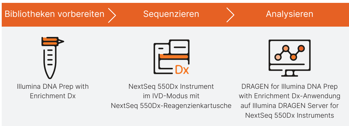
Abbildung 1: IVDR-konforme NGS-Analyse von Proben auf DRAGEN Server for NextSeq 550Dx Instruments: Der gezielte Sequenzierungsworkflow umfasst die Bibliotheksvorbereitung extrahierter Proben mit dem NGS-Workflow von Illumina DNA Prep with Enrichment Dx, die Sequenzierung auf dem NextSeq 550Dx Instrument und die genaue IVDR-konforme Analyse auf DRAGEN Server for NextSeq 550Dx Instruments.