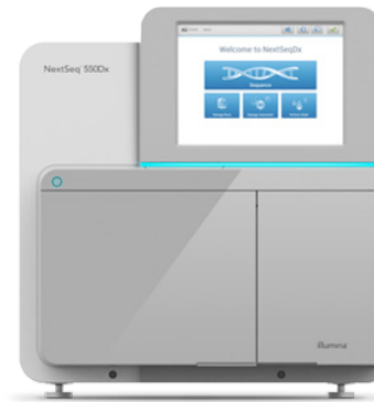
Abbildung 2: NextSeq 550Dx Instrument: Das NextSeq 550Dx Instrument liefert hochwertige Ergebnisse für Anwendungen im klinischen Bereich und in der Forschung.

Beim NextSeq 550Dx Instrument handelt es sich um ein leistungsstarkes Tischsequenziersystem, das speziell in Hinblick auf die Anforderungen klinischer Labore entwickelt wurde (Abbildung 2). Das NextSeq 550Dx Instrument ist ein FDA-konformes IVD-System ( In-vitro -Diagnostik) mit CE-Kennzeichen, das Diagnoselaboren die Entwicklung und Durchführung von IVD-Assays auf Basis von NGS ermöglicht – von gezielten Panels bis hin zur Analyse von Exomen.