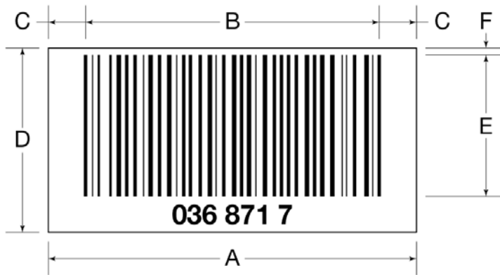
Figura 2 Dimensioni del codice a barre