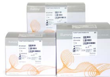
Figure 1 : Trousse d'amplicons personnalisés TruSeq Dx : la trousse d'amplicons personnalisés TruSeq Dx, réglementée par la FDA et portant le marquage CE-IVD, fournit des réactifs de préparation de librairies qui permettent aux laboratoires cliniques de développer leurs propres tests diagnostiques à utiliser sur les instruments de séquençage Dx d'Illumina.

L'utilisation des réactifs validés élimine la nécessité de consacrer de précieuses ressources de laboratoire à la revalidation des réactifs ou des tests pour les analyses suivantes. Le flux de travail rapide et efficace ne nécessite simplement que 50 ng d'ADN génomique (ADNg) ou 10 µl d'ADN FFPE qualifié pour générer des librairies de séquençage de grande qualité en moins de deux jours.