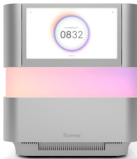
Figura 1: NextSeq 2000 Sequencing System: El sistema NextSeq 2000 ofrece características de diseño innovadoras, procesos químicos avanzados, una bioinformática simplificada y un flujo de trabajo intuitivo que posibilita la más amplia gama de aplicaciones y flexibilidad para los sistemas de secuenciación de sobremesa.

El resultado: NextSeq 1000 Sequencing System y NextSeq 2000 Sequencing System de Illumina son plataformas flexibles para la investigación de hoy y de mañana.