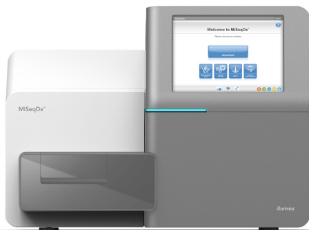
Figure 1: Instrument MiSeqDx : réglementé par la FDA et homologué CE-IVD, l'instrument MiSeqDx propose un flux de travail simple, une interface logicielle conviviale et une sécurité améliorée pour l'utilisateur.

L'instrument MiSeqDx est la première plateforme de séquençage de nouvelle génération (SNG) réglementée par la Food and Drug Administration des États-Unis (FDA) et homologuée pour la conformité européenne relative aux dispositifs de diagnostic in vitro (CE-IVD) (figure 1). Spécialement conçu pour être utilisé en environnement de laboratoire clinique, l'instrument MiSeqDx prend peu de place (0,3 mètre carré), offre un flux de travail simple et génère des données de sortie sur mesure pour répondre aux besoins des laboratoires cliniques. Le logiciel intégré sur instrument permet la configuration des analyses, le suivi des échantillons, la gestion des utilisateurs, les pistes de vérification et l'interprétation des résultats*. En exploitant la chimie de séquençage par synthèse (SBS) éprouvée d'Illumina, l'instrument MiSeqDx fournit un dépistage et des tests diagnostiques précis et fiables.