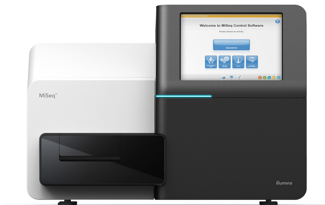
Figura 1: MiSeq System. MiSeq System es un instrumento compacto idóneo para la secuenciación de nueva generación rápida y rentable.

MiSeq System ofrece la primera plataforma de secuenciación de ADN a datos que integra la generación de grupos, la amplificación, la secuenciación y el análisis de datos en un único instrumento. Por sus pequeñas dimensiones —aproximadamente unos 0,19 m 2 — encaja en prácticamente cualquier entorno de laboratorio (figura 1). MiSeq System aprovecha el proceso químico de secuenciación por síntesis (SBS, sequencing by synthesis) de Illumina, una tecnología de secuenciación de nueva generación (NGS, next-generation sequencing) probada y que ha permitido generar más del 90 % de los datos de secuenciación en todo el mundo. 1 Por la potencia de la NGS y el poco espacio que ocupa, MiSeq System es la plataforma ideal para un análisis genético rápido y rentable.