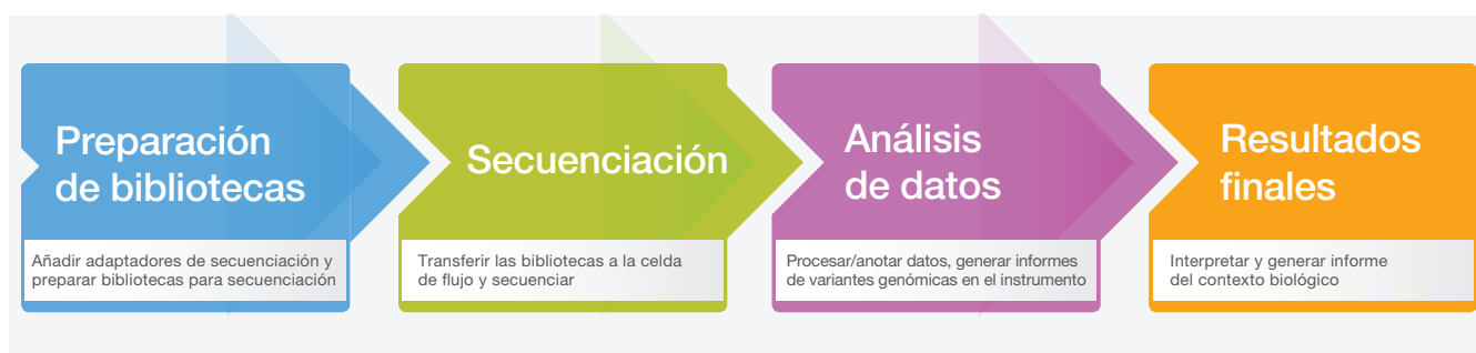
Figura 2: Flujo de trabajo de MiSeq System. El flujo de trabajo optimizado de MiSeq System permite un tiempo de procesamiento rápido para la secuenciación de nueva generación de sobremesa. Las bibliotecas se pueden preparar con cualquier kit de preparación de bibliotecas compatible. El tiempo de secuenciación de cinco horas y media incluye la generación de grupos, la secuenciación y la llamada de bases con puntuación de calidad con adquisición de imágenes de las dos superficies para cada experimento de 2 × 25 pares de bases en un MiSeq System con MiSeq Control Software.

incluyen el análisis de datos integrado y acceso a BaseSpace™ Sequence Hub, la plataforma informática basada en la nube para genómica de Illumina. BaseSpace Sequence Hub proporciona carga de datos en tiempo real, herramientas sencillas de análisis de datos, supervisión de experimentos a través de Internet, además de una solución de almacenamiento segura y flexible. Un paquete de herramientas de análisis de datos y una lista cada vez más extensa de aplicaciones de análisis de terceros facilitan los procesos informáticos de los investigadores. BaseSpace Sequence Hub también permite compartir datos con compañeros o clientes de manera fácil y rápida.